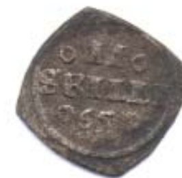
2 sk 1565 Hede 16 Sølv lødighed ca. 20 %

Generalforsamling og auktion. Numismatisk Forening afholder medlemsmøde med generalforsamling og auktion tirsdag den 8. april 2008 kl. 19.30 i Nygadehuset i Aabenraa.