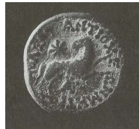
Figur 1. Den første bronzemønt fra Antiokia, som afbilder stjernetegnet Vædderen, udgivet ca. år 5-11 A.D. (RPC-1 4265).

Stjernetegnet for Judæa var Vædderen, placeret mellem Fiskene og Tyrens stjernetegn, og ikke Fiskene, som ellers var den normale opfattelse) og skulle begivenheder af betydning for Judæa vise sig på himlen burde det med datidens logik ske i stjernetegnet Vædderen og det er her at den antikke numismatik spiller en rolle. Der kendes ingen mønter fra selve Judæa med en vædder afbildet, men netop for perioden omkring Kristi fødsel kendes en række mønter fra byen Antiokia, lidt nord for Judæa. På det tidspunkt var Antiokia sammen med Judæa under Romersk herredømme og slået sammen til én provins under Syrien. De første af mønterne blev møntet år 5-11, omkring det tidspunkt hvor Quirinius var guvernør i Syrien. Se fig. 1. Så der er stor sandsynlighed for at de observationer som kunne tolkes som Bethlehem-stjernen ville finde sted i Vædderen og søger man i Vædderen, i stedet for i Fiskene, finder man kun én begivenhed som fandt sted i det relevante tidsrum og som kan passe med beskrivelsen af begivenheden.